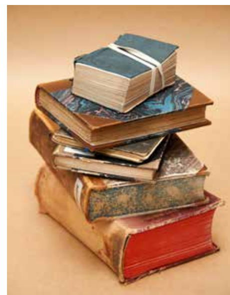
Gamle kilder er en glede å lete i. Vakre er de også.

3. Du må lære deg å tyde håndskrifter når du leter i gamle kirkebøker. Med litt trening går det fint. Og det er de utroligste nedtegnelser du kommer over.