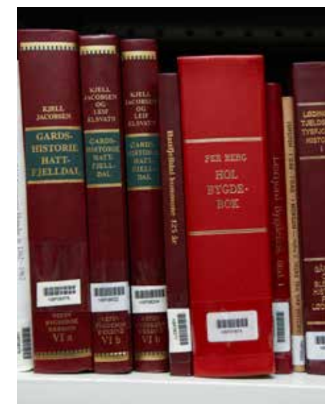
Har du slekt fra en gård på landsbygda er bygdebøkene et godt sted å lete etter tidligere generasjoner.