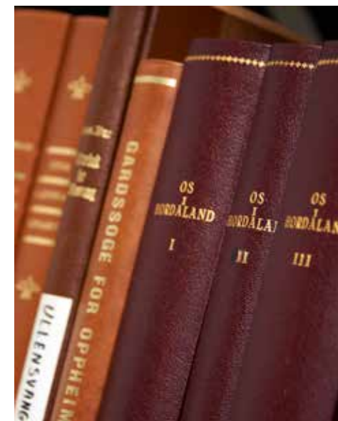
Skinninnbundne permer skjuler mye.